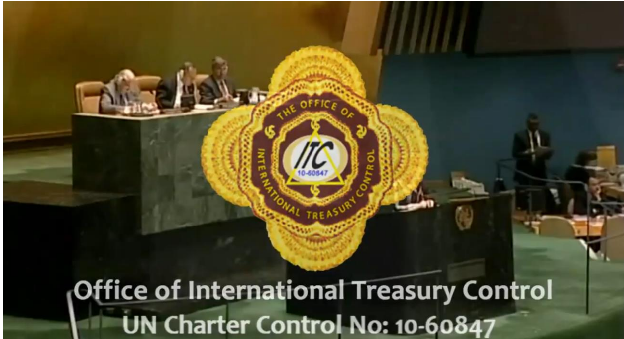
Office of International Treasury Control UN Charter Control No: 10-60847

litiges politiques ou judiciaires locaux, protégeant ainsi le détenteur et le système contre toute poursuite extérieure.