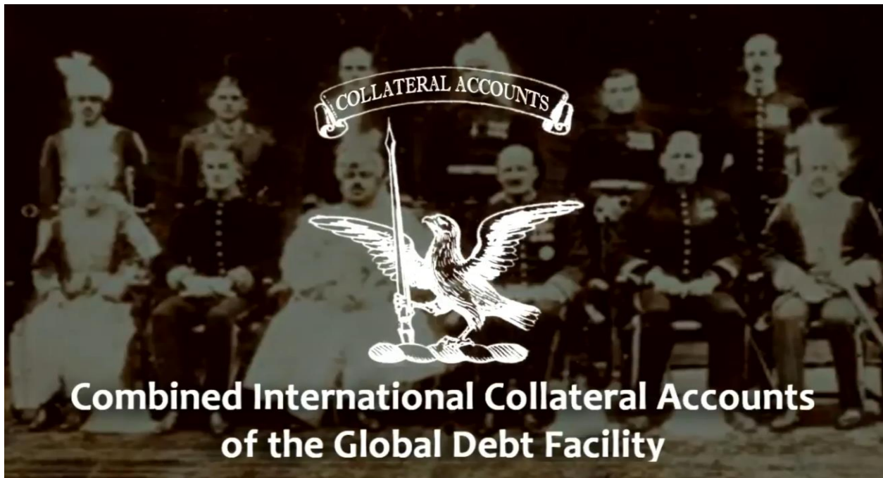
Combined International Collateral Accounts of the Global Debt Facility